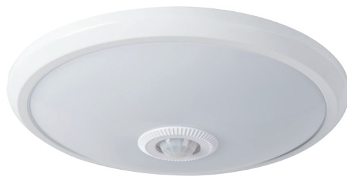
FOGLER LED 14W-NW