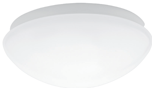
PIRES ECO DL-250 NS