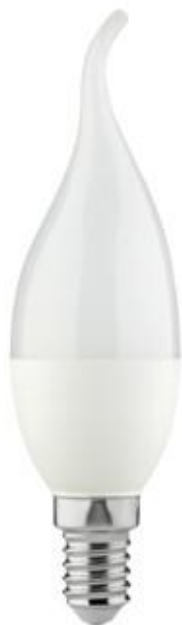
IDO 6,5W E14