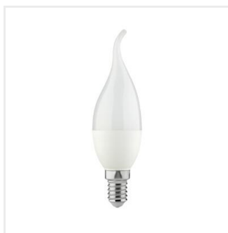
IDO 6,5W E14