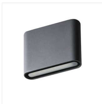
GARTO LED EL 8W-GR