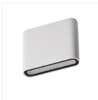
GARTO LED EL 8W-W