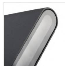
GARTO LED EL 8W-GR