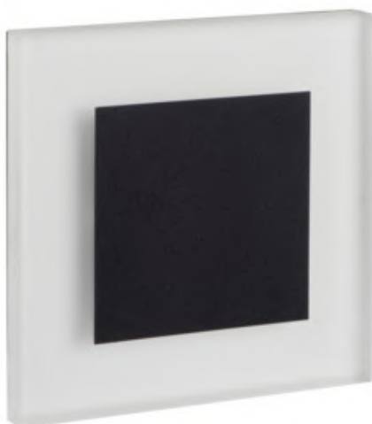
APUS LED B, APUS LED AC B