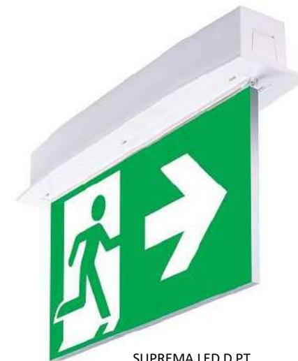
SUPREMA LED D PT