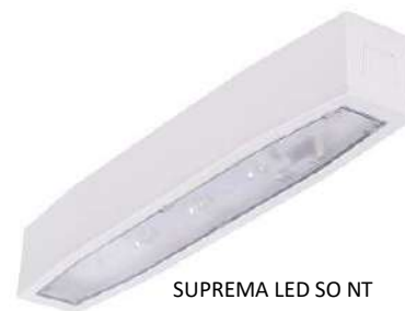
SUPREMA LED SO NT