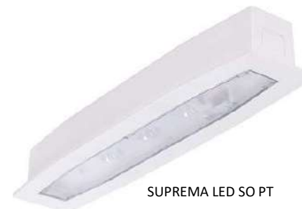
SUPREMA LED SO PT