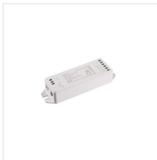
CTRL 12/24V 10A RGBW