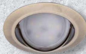
23846 TRIBIS II O AB

W zestawie można wybrać oczka okrągłe lub kwadratowe.