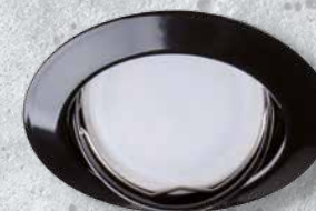
23855 TRIBIS II O B