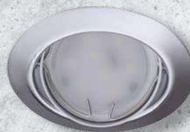
23847 TRIBIS II O C