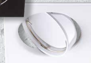
23849 TRIBIS II L W