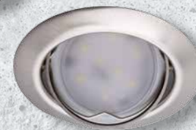
23848 TRIBIS II O C/M