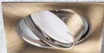
23843 TRIBIS II L AB

w pięciu ciekawych kolorach: chromie, matowym chromie, patynowym mosiądku oraz klasycznej czerni i bieli.