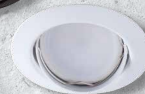
23854 TRIBIS II O W