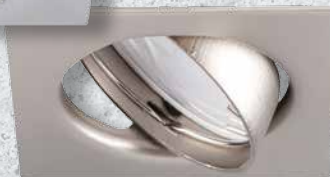
23845 TRIBIS II L C/M