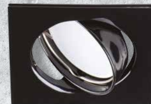
23853 TRIBIS II L B