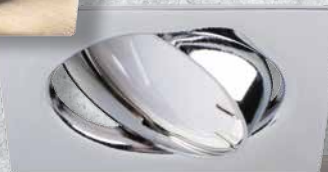
23844 TRIBIS II L C