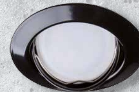
23855 TRIBIS II O B