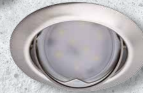
23848 TRIBIS II O C/M