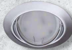
23847 TRIBIS II O C