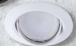
23854 TRIBIS II O W