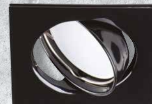
23853 TRIBIS II L B