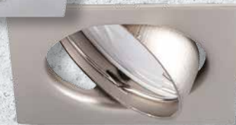
23845 TRIBIS II L C/M