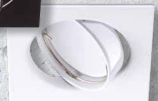
23849 TRIBIS II L W