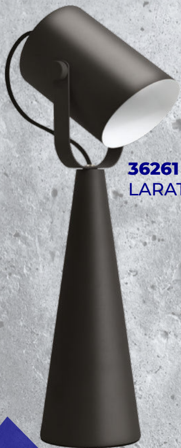
36261 LARATA E27 B

to rodzina opraw obejmująca lampę stołową LARATA E27 i spot jednopunktowy LARATA EL .