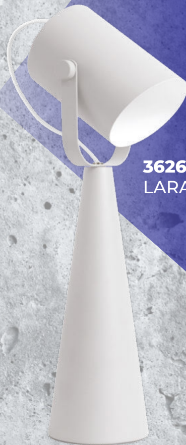
36260 LARATA E27 W