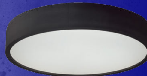
29205 JASMIN 470-B