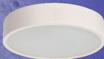
23124 JASMIN 370-W