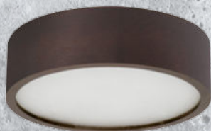
23120 JASMIN 270-WE