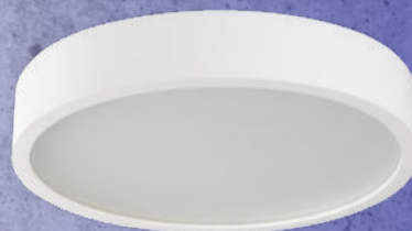
23127 JASMIN 370-W/M