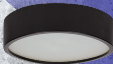
29208 JASMIN 370-B