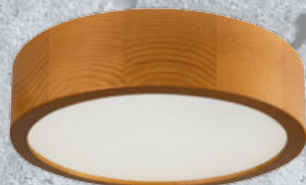
36440 JASMIN 270-G/O