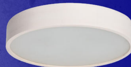
23125 JASMIN 470-W