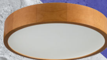
36441 JASMIN 370-G/O