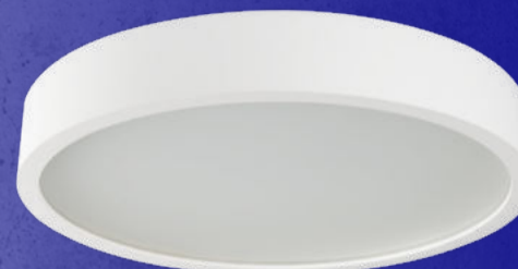
23128 JASMIN 470-W/M