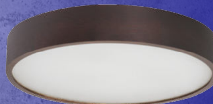
23122 JASMIN 470-WE