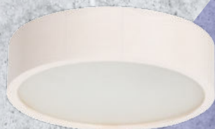
23123 JASMIN 270-W

Modele Kanlux JASMIN w kolorach: dąb sonoma, wenge, złoty dąb z widoczną strukturą drewna.