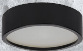
29207 JASMIN 270-B