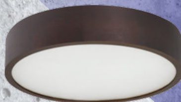
23121 JASMIN 370-WE