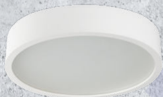
23126 JASMIN 270-W/M

Modele Kanlux JASMIN w kolorach: biały mat i czarny z pełnym kryciem kolorów bez widocznych struktur drewna.