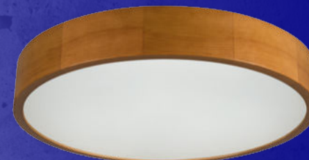
36442 JASMIN 470-G/O