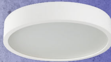
23127 JASMIN 370-W/M