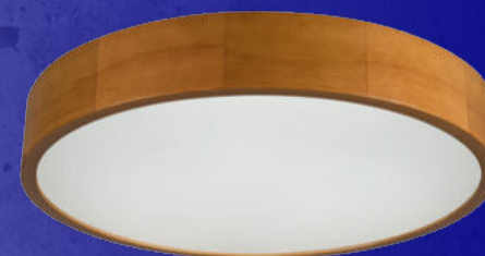
36442 JASMIN 470-G/O