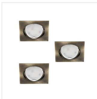
TRIBIS II L AB