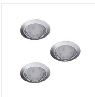
TRIBIS II O C