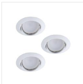
TRIBIS II O W

Zestaw opraw do wbudowania wraz z źródłem