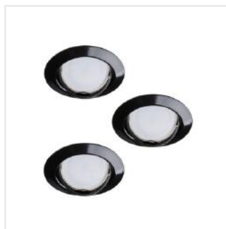
TRIBIS II O B