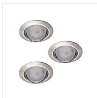
TRIBIS II O C/M