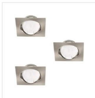
TRIBIS II L C/M