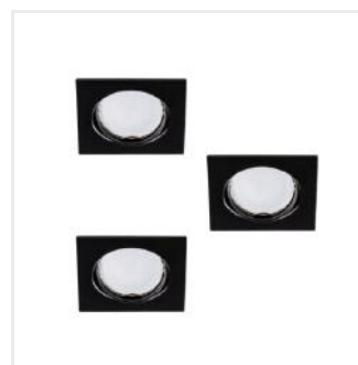
TRIBIS II L B