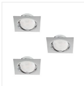
TRIBIS II L C