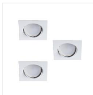
TRIBIS II L W