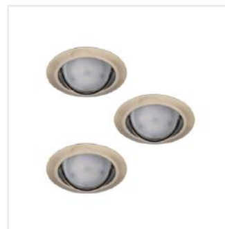
TRIBIS II O AB