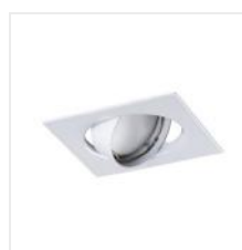
TRIBIS II L AB