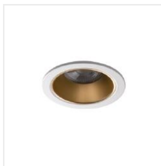
GLOZO DSO G/W