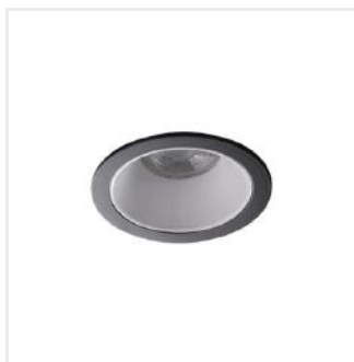
GLOZO DSO W/B