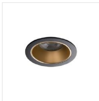
GLOZO DSO G/B