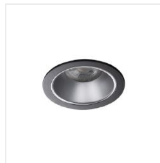
GLOZO DSO SR/B