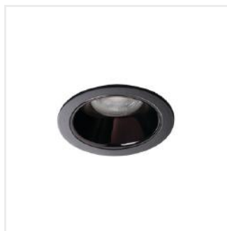
GLOZO DSO B/B