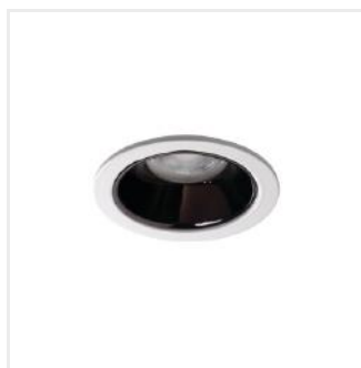
GLOZO DSO B/W