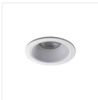
GLOZO DSO W/W