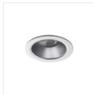
GLOZO DSO SR/W