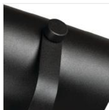
LARATA E27 W