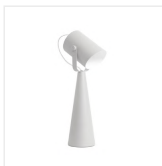
LARATA E27 W