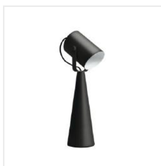
LARATA E27 B