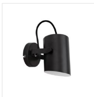
LARATA EL-10 B