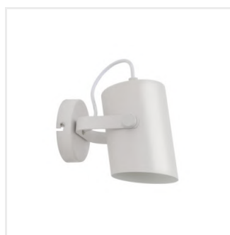
LARATA EL-10 W