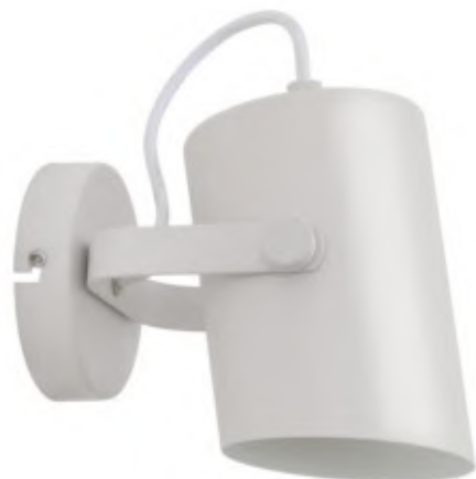
LARATA EL-10 W