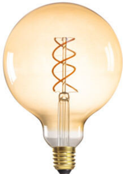
XLED G125 4W-SW