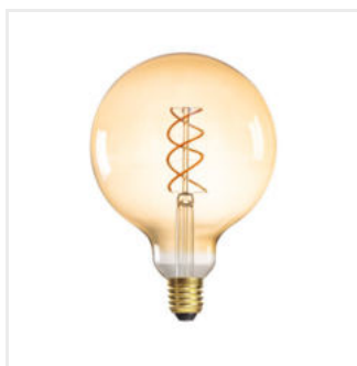
XLED G125 4W-SW