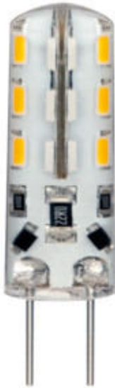
TANO G4 SMD-WW