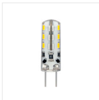
TANO G4 SMD-NW