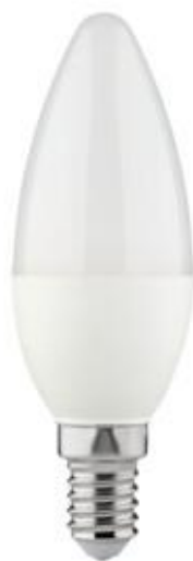
IQ-LED C35E14 3,4W-NW