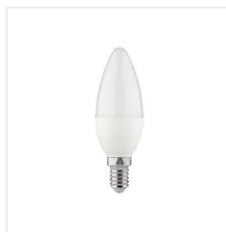
IQ-LED C35E14 5,9W-NW