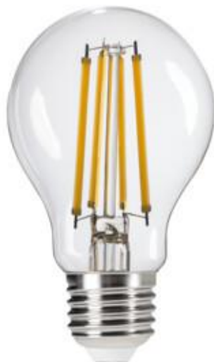
XLED EX A60 4W-WW