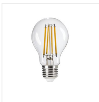
XLED EX A60 4W-WW