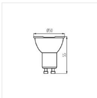
IQ-LED GU10 4,9W