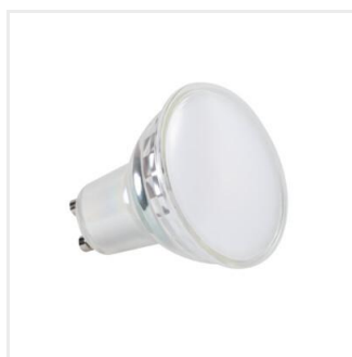
IQ-LED GU10 4,9W-NW