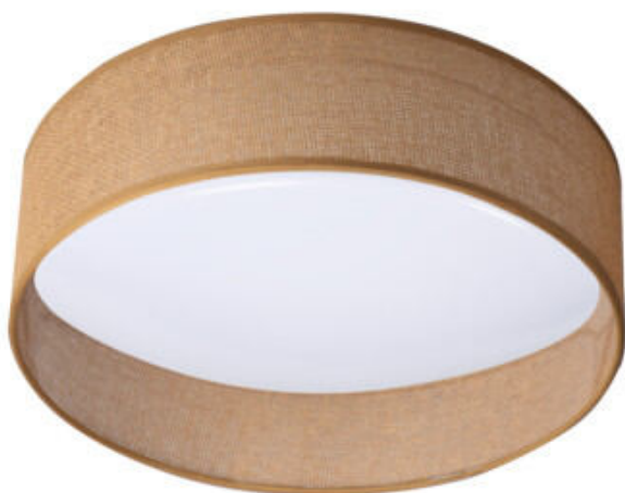
RIFA LED 17,5W N2