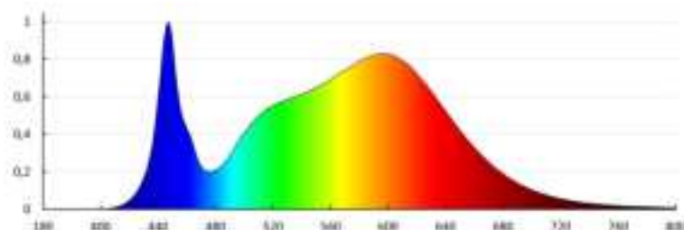
KANLUX S.A. (dot. 37266) BLINGO U E125LM 120NW / Krzywa rozkładu światła (Długopisowo)