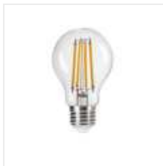
XLED A60 10W-WW