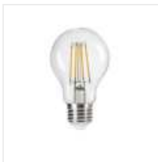
XLED A60 4,5W-WW