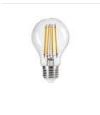
XLED A60 8W-NW