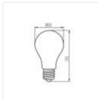
XLED A60 10W