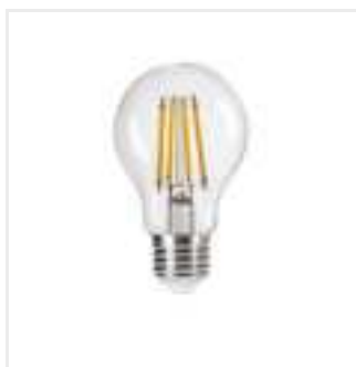
XLED A60 7W-NW