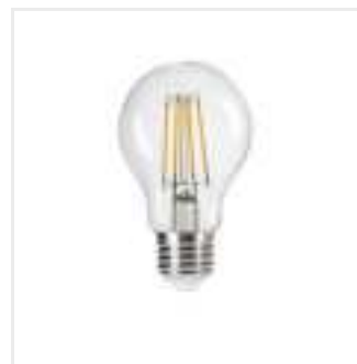
XLED A60 4,5W-NW