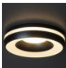
ELICEO DSO B/B