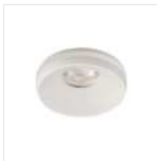
ELICEO DSO W