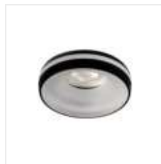
ELICEO DSO B