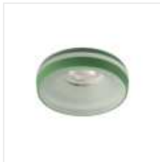
ELICEO DSO GR