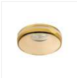
ELICEO DSO YG