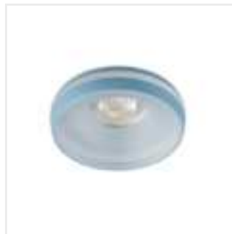
ELICEO DSO BL