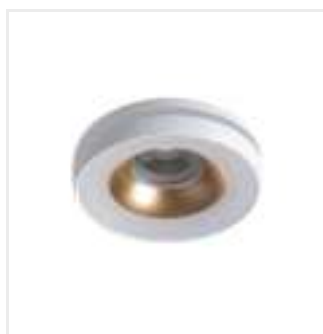
ELICEO DSO W/G