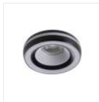
ELICEO-ST DSO B/B