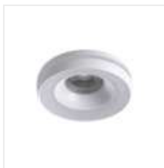
ELICEO DSO W/W