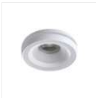
ELICEO-ST DSO W/W