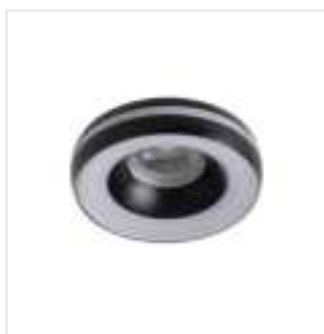
ELICEO DSO B/B