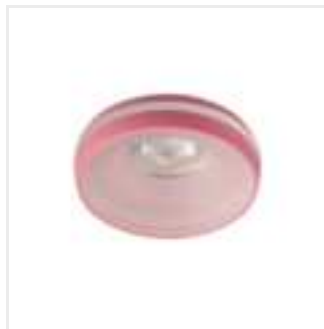
ELICEO DSO PK