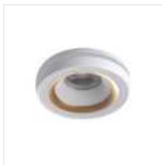
ELICEO-ST DSO W/G