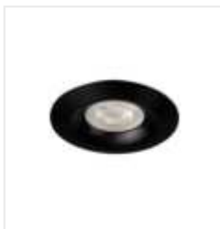
LIGLO DSO B