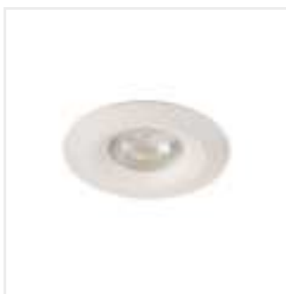
LIGLO DSO W