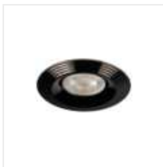
LIGLO DSO BC