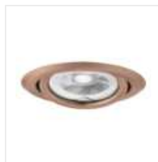
ARGUS II CT-2115-AN