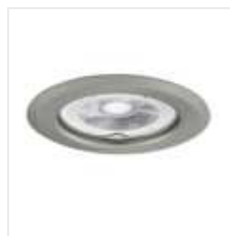
ARGUS II CT-2114-C/M