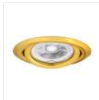
ARGUS II CT-2115-G