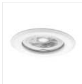
ARGUS II CT-2114-W