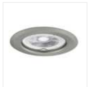
ARGUS II CT-2114-C/M