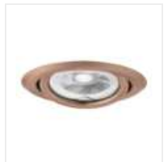
ARGUS II CT-2115-AN