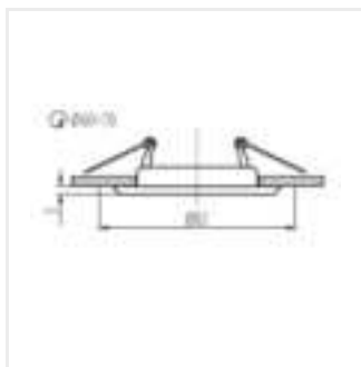
ARGUS II CT-2114