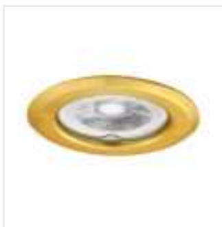
ARGUS II CT-2114-G