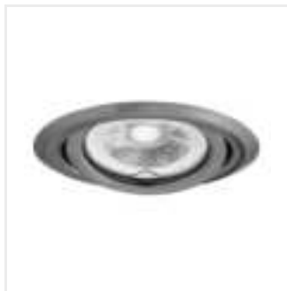
ARGUS II CT-2115-GM