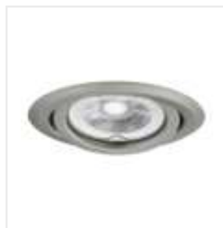
ARGUS II CT-2115-C/M