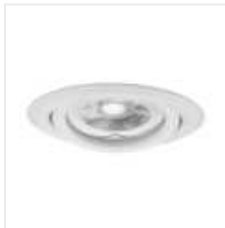
ARGUS II CT-2115-W