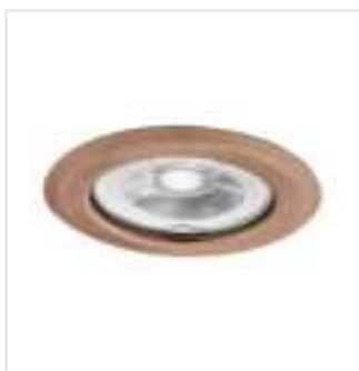
ARGUS II CT-2114-AN