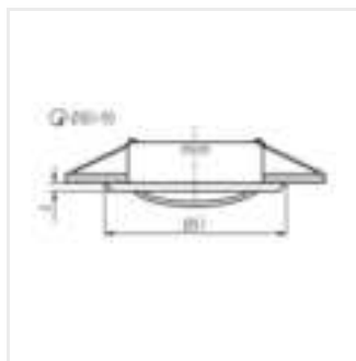
ARGUS II CT-2115