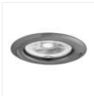
ARGUS II CT-2114-GM