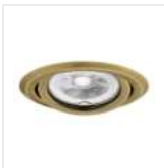
ARGUS II CT-2115-BR/M