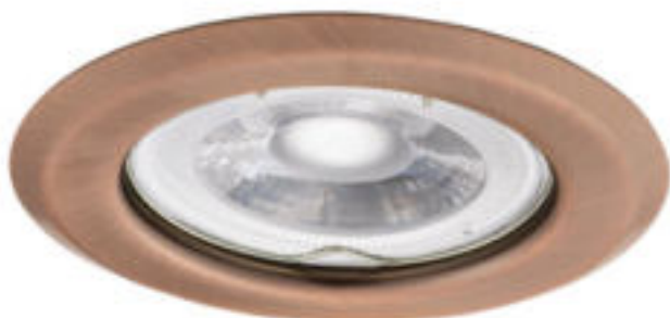
ARGUS II CT-2114-AN