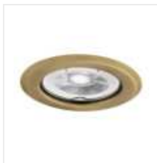
ARGUS II CT-2114-BR/M