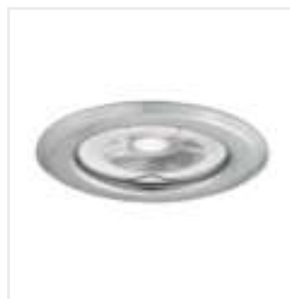
ARGUS II CT-2114-C