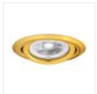
ARGUS II CT-2115-G