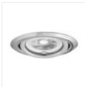
ARGUS II CT-2115-C