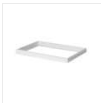
ADTR-H 3060 W