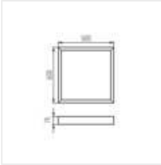
ADTR-H 76MM 6060