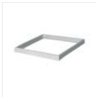
ADTR-H 76MM 6060 SR