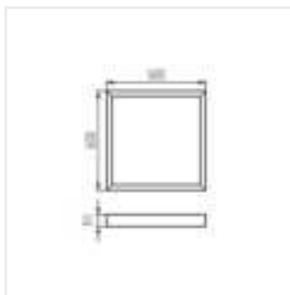
ADTR-S-H 6060 W