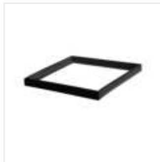
ADTR-H 6060 B