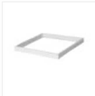
ADTR-H 6060 W