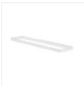
ADTR-H 12030 W