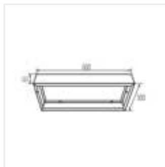
ADTR-H 3060 W