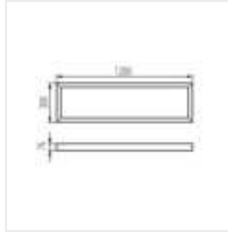
ADTR-H 76MM 12030 W