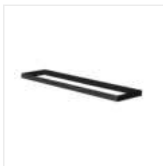
ADTR-H 12030 B