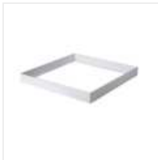
ADTR-S-H 6060 W