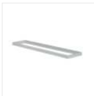
ADTR-H 12030 SR