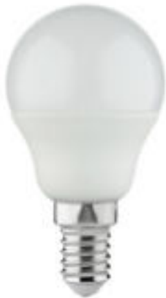
IQ-LED G45E14 3,4W