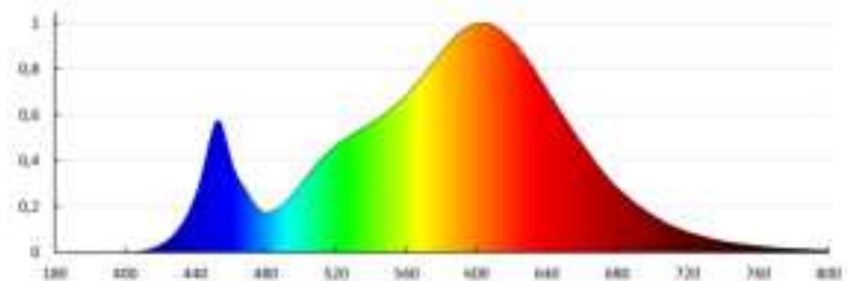
KANLUX S.A. (ul. Dębna) BILO 6,5W E27-WW / Krzywa rozkładu światła (długopiętło)

Opis: KANLUX S.A. (ul. Dębna) BILO 6,5W E27-WW