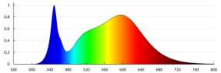
KANLUX S.A. (ul. Świerki) MAH PRO 52W 15R-NW / Krzywa rozkładu światła (Współnowe)

Oprawa: MAH PRO 52W 15R-NW Lampa: 1 x 38141 MAH PRO 52W 15R-NW